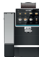
BREAK S W8L